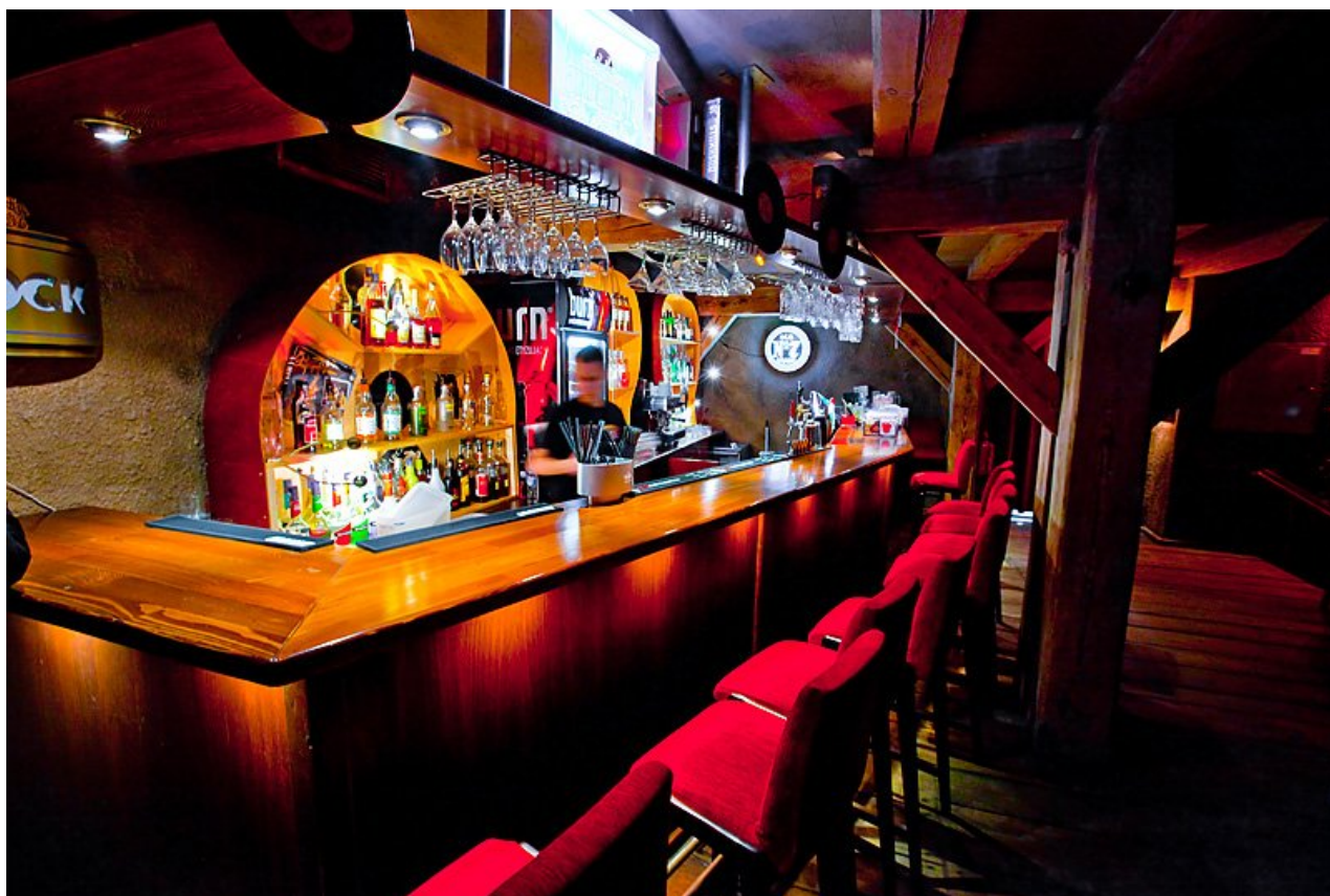
bar – antresola

więcej zdjęć: www.facebook.com/LizardKingTorun