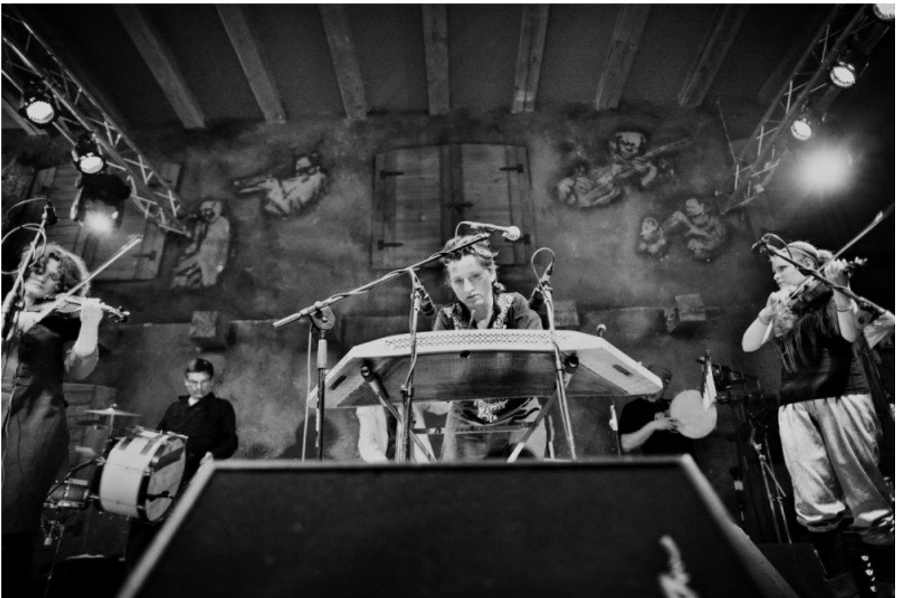
Kapela Ze Wsi Warszawa