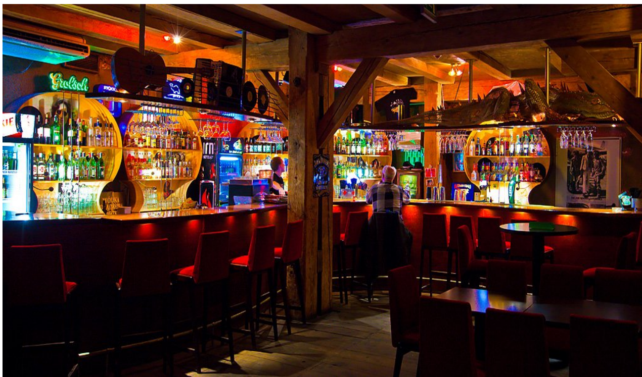
bar – dół